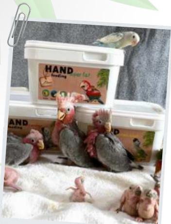
Eolophus roseicapilla e Conuri del sole allevati con la formula Protein Boost