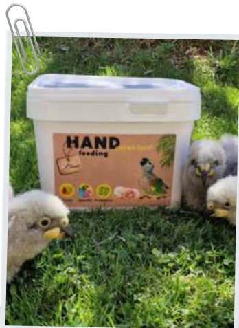
Nestor notabilis è cresciuto con la formula Protein Boost