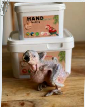
Ara Ararauna è cresciuta con la formula Pro Energy Hand Feeding