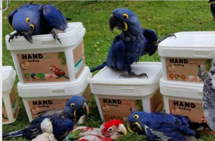
Uno stormo di Anodorhynchus hyacinthinus cresce con la formula Super Fat