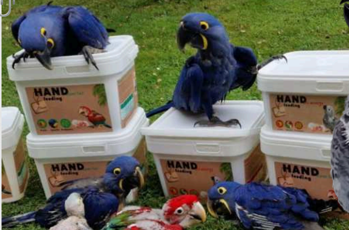
Een kudde Anodorhynchus hyacinthinus kweekt met de Super Fat Formula