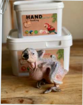
Ara Ararauna is opgevoerd met de Pro Energy Handvoedingsformula