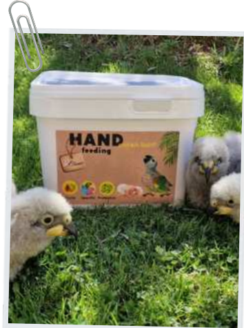
Nestor notabilis groeide op met de Protein Boost Formula