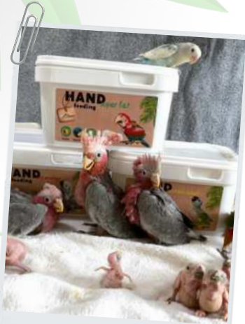
Eolophus roseicapilla & Sun Conures gekweekt met de Protein Boost Formula